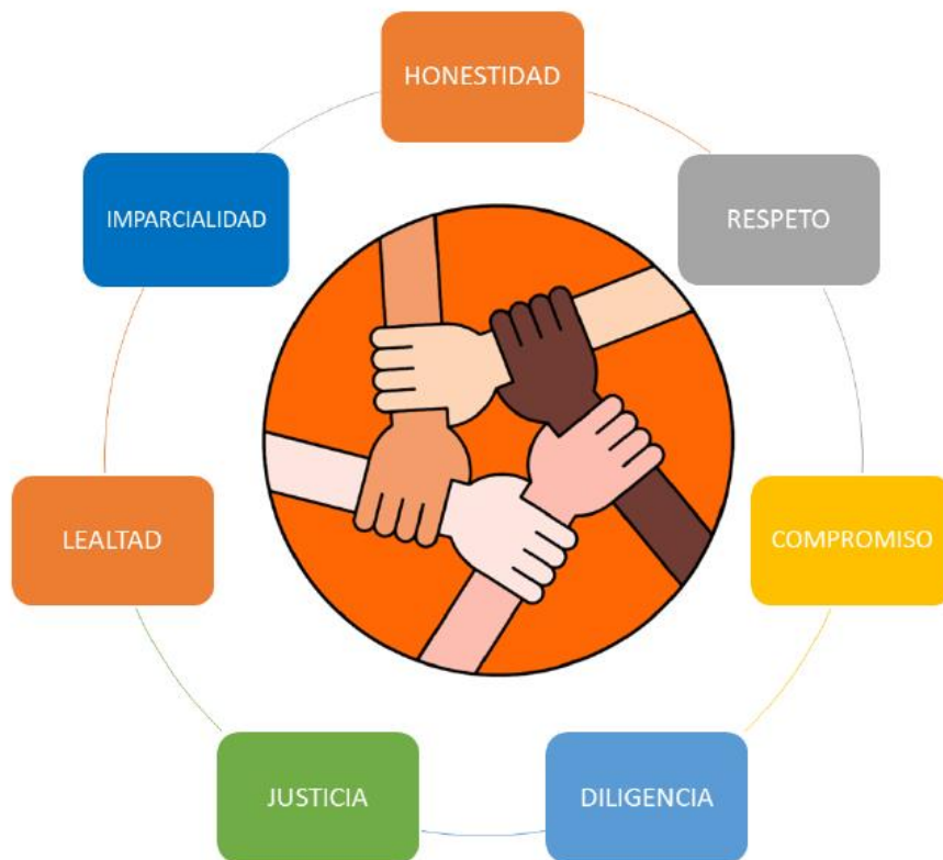
Ilustración 1: Valores Institucionales