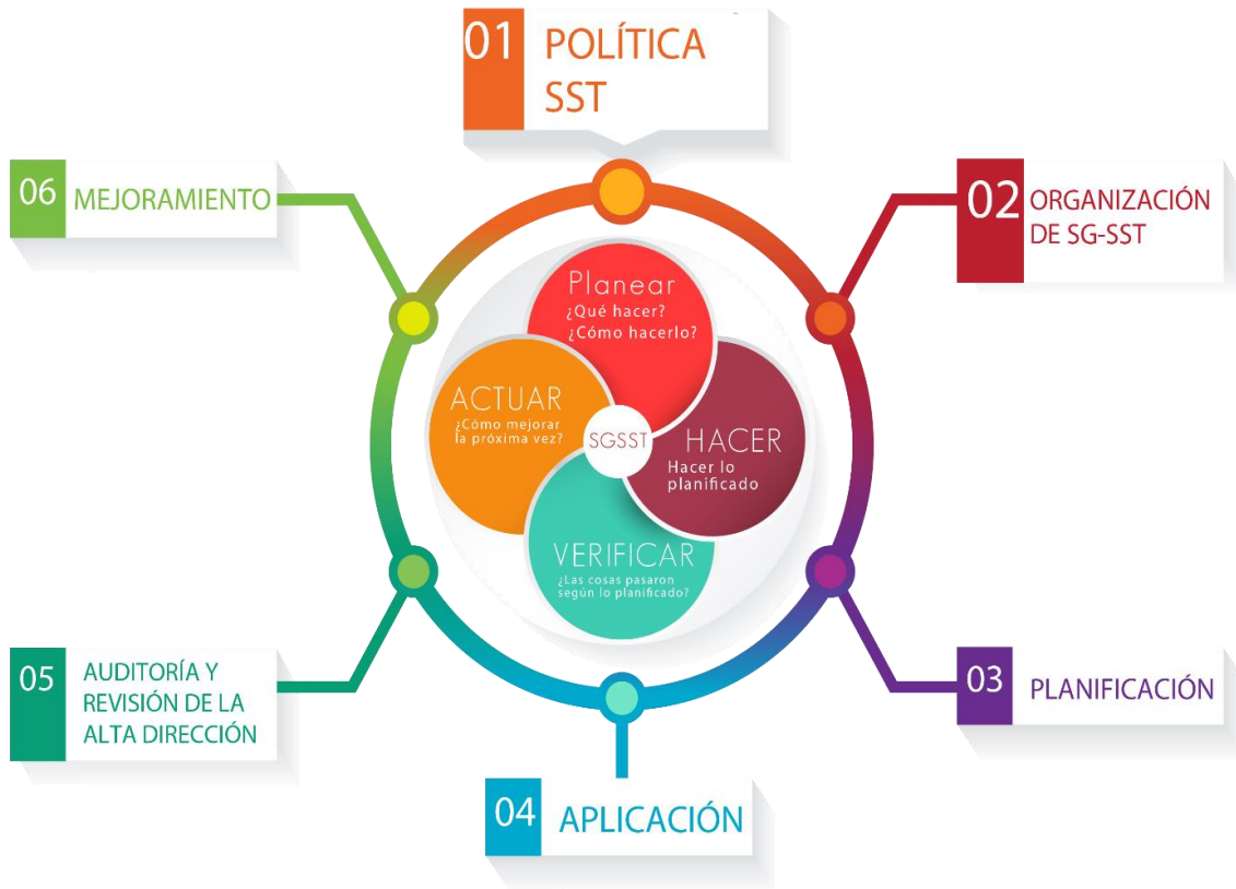
Tabla: Esquema del Sistema de Gestión de Seguridad y Salud en el Trabajo.